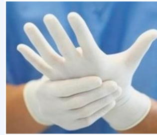
Guantes de látex