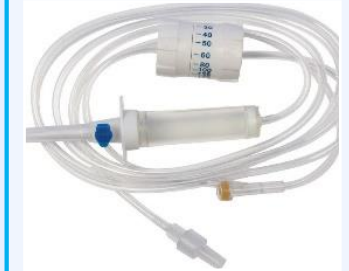
Equipos de Infusión