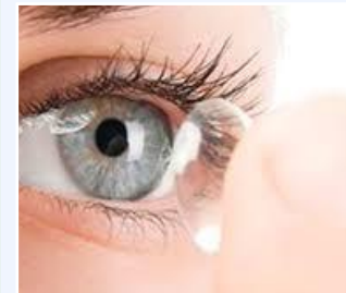
Lentes de Contacto