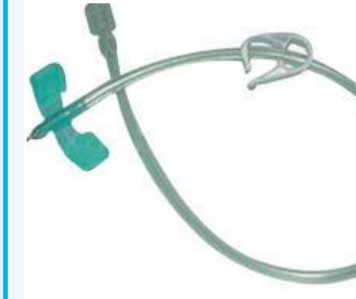
Catéteres Intravenosos Periféricos