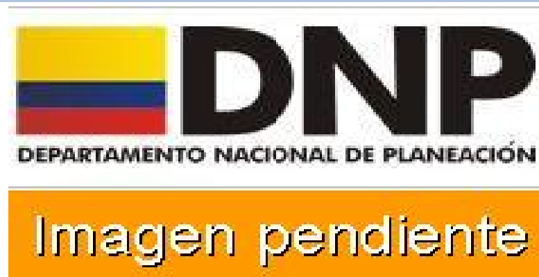
IMAGEN DEL PROYECTO