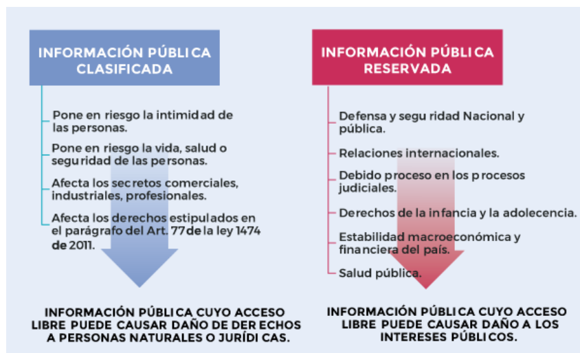
Ilustración 2. Información clasificada y reservada.

En las áreas misionales, técnicas y jurídicas del Invima se encargan de evaluar la pertinencia y legalidad de exponer la información de manera pública, los abogados de las áreas analizan los datos a exponer y determinan si la información es pública, clasificada o reservada, luego los datos son remitidos a la Oficina de TI, que es la encargada de publicar los conjuntos de datos en la plataforma www.datos.gov.co .