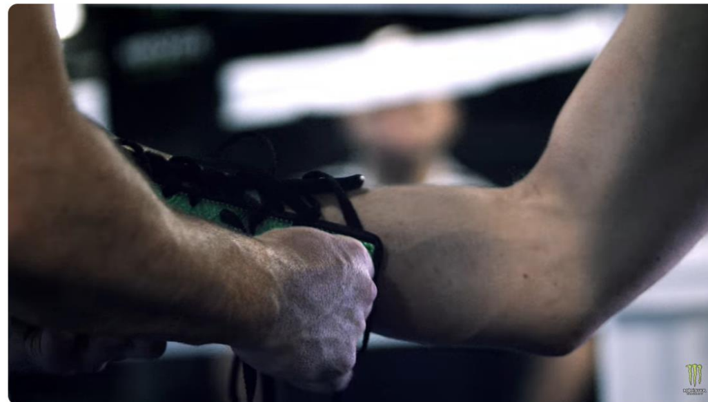
Monster Energy: Conor McGregor - #IAMTheBeast