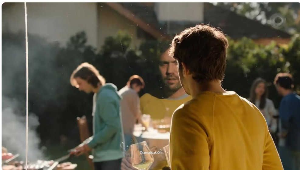
ARMONIL (Argentina 2022)